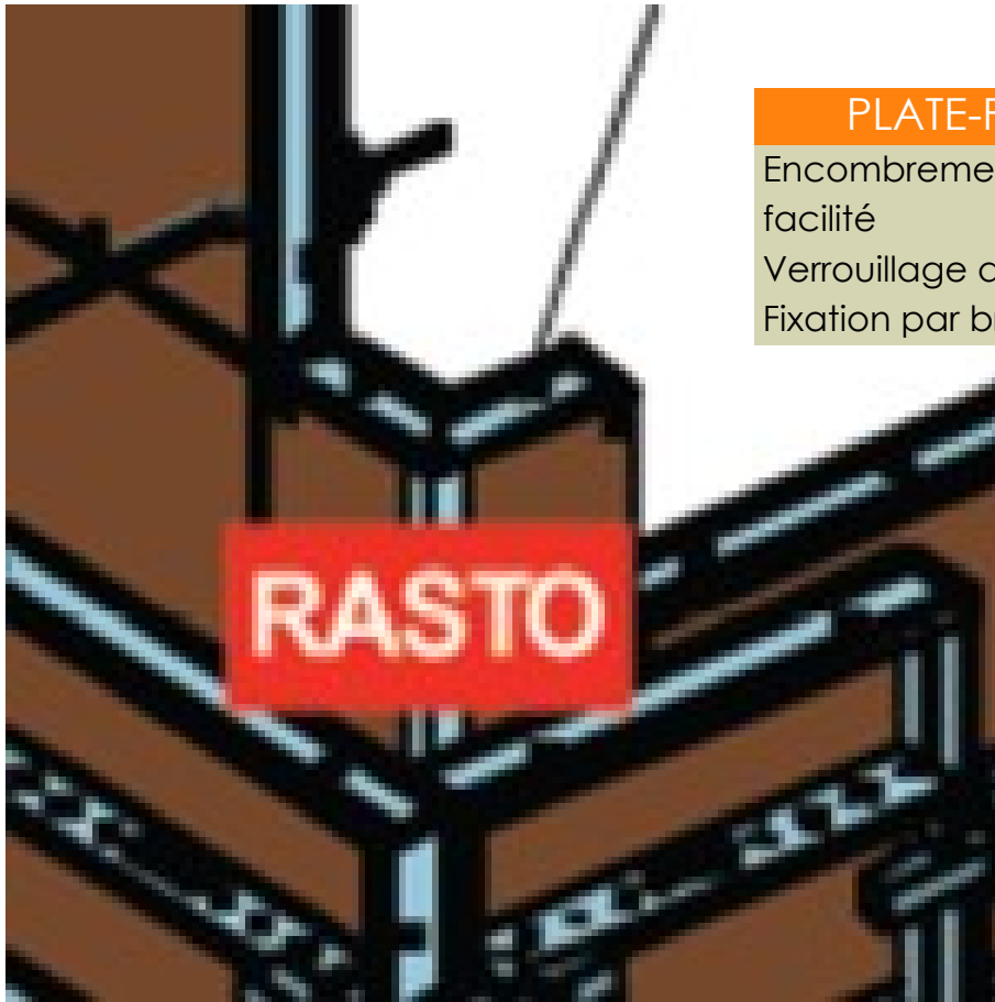
PLATE-FORME SATECO P3D

Encombrement réduit pour stockage facilité