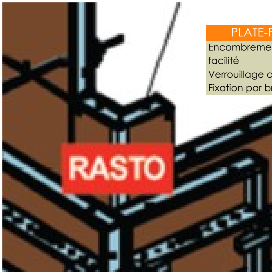
PLATE-FORME SATECO P3D

Encombrement réduit pour stockage facilité