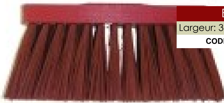
BALAI DE RUE - PVC