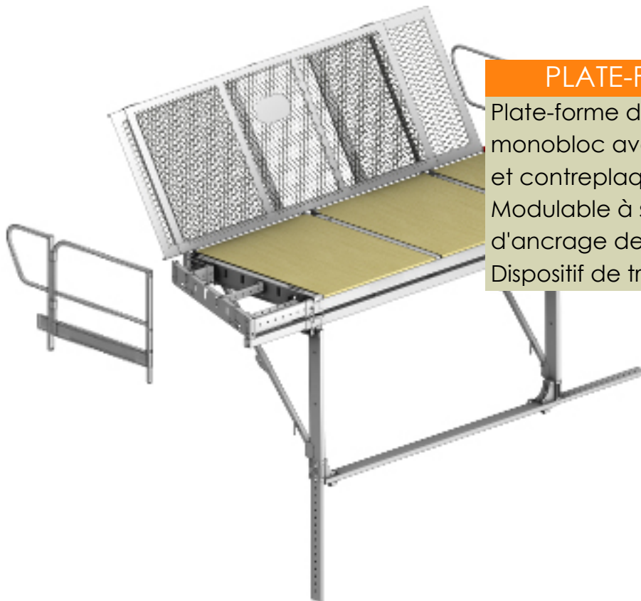
PLATE-FORME SATECO P3D

Plate-forme de travail en structure monobloc avec plateau central tubulaire et contreplaqué Modulable à souhait avec possibilité d'ancrage de banches métalliques Dispositif de tracabilité intégré